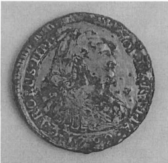
Tema: "Moneda de un real" Vista anterior