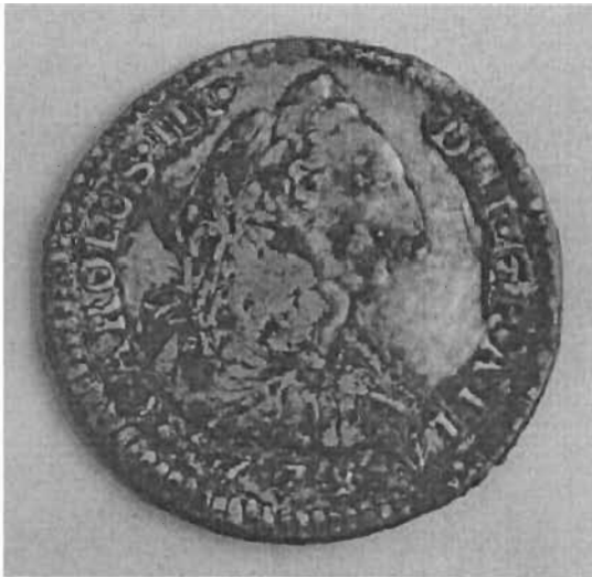
Tema: "Moneda de un real" Vista anterior