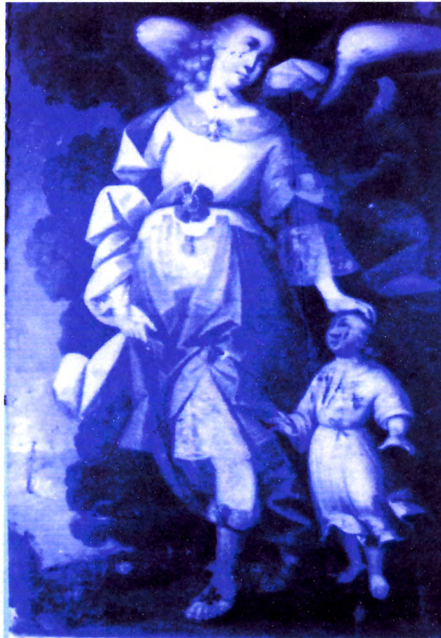
"Ángel de la Guarda"