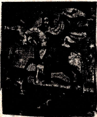
Santiago Matamoros Anónimo Siglo: XIX Dim: 50 x 40 cms.