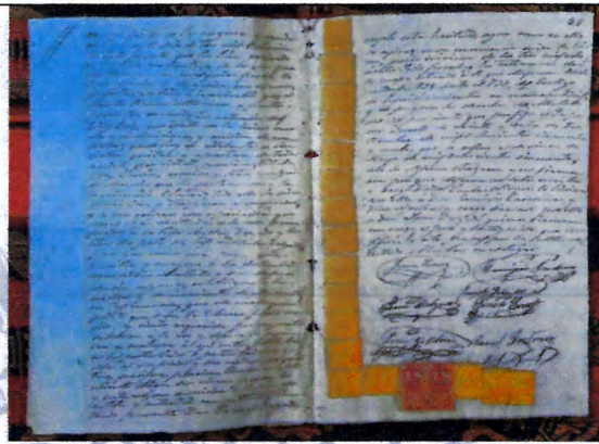
Folios 54 (verso) y 55 (recto)