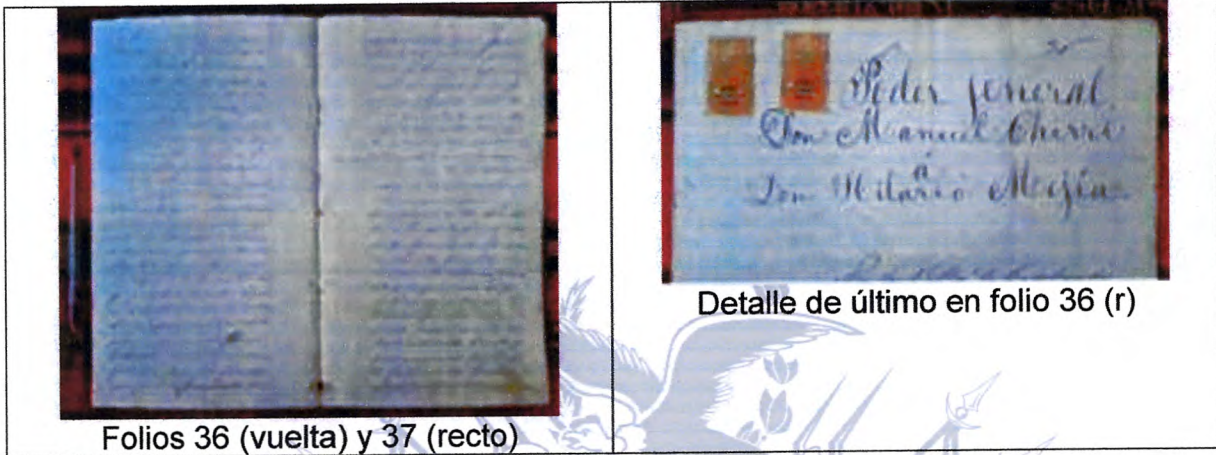
Folios 36 (vuelta) y 37 (recto)

Ministerio de Educación, Deportes y Culturas