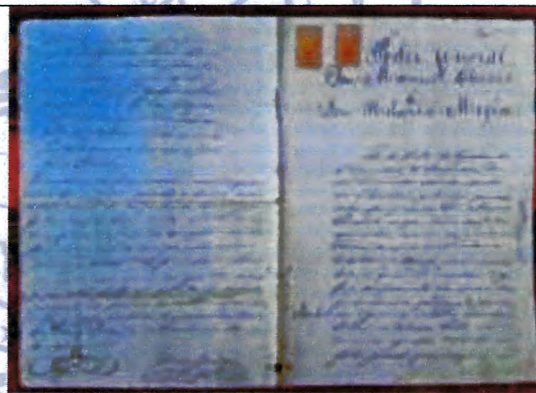
Folios 36 (recto) y 37 (verso)