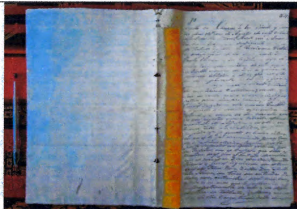
Folio 54 (recto) y 55 (verso)