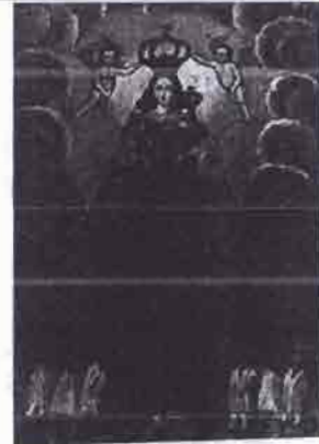
La Virgen de los Remedios