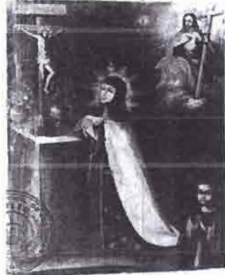
Santa Teresa de Jesús