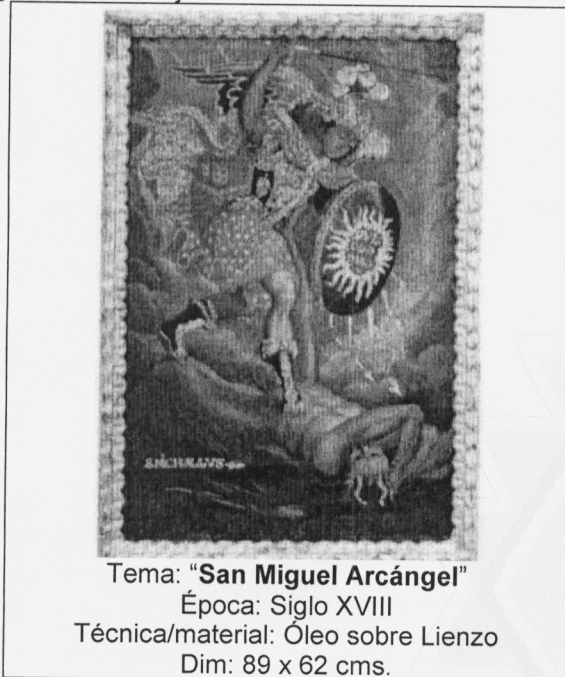
Tema: "San Miguel Arcángel" Época: Siglo XVIII Técnica/material: Óleo sobre Lienzo Dim: 89 x 62 cms.

Agradeciendo de antemano su atención, expreso a usted mis consideraciones más distinguidas.